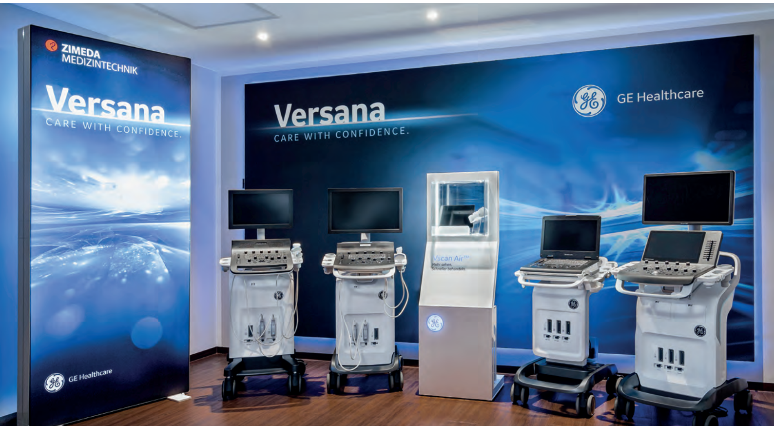
Zimeda SonoStore in Passau