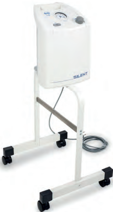
Abbildung zeigt Sonderausstattung. Made in Swiss.